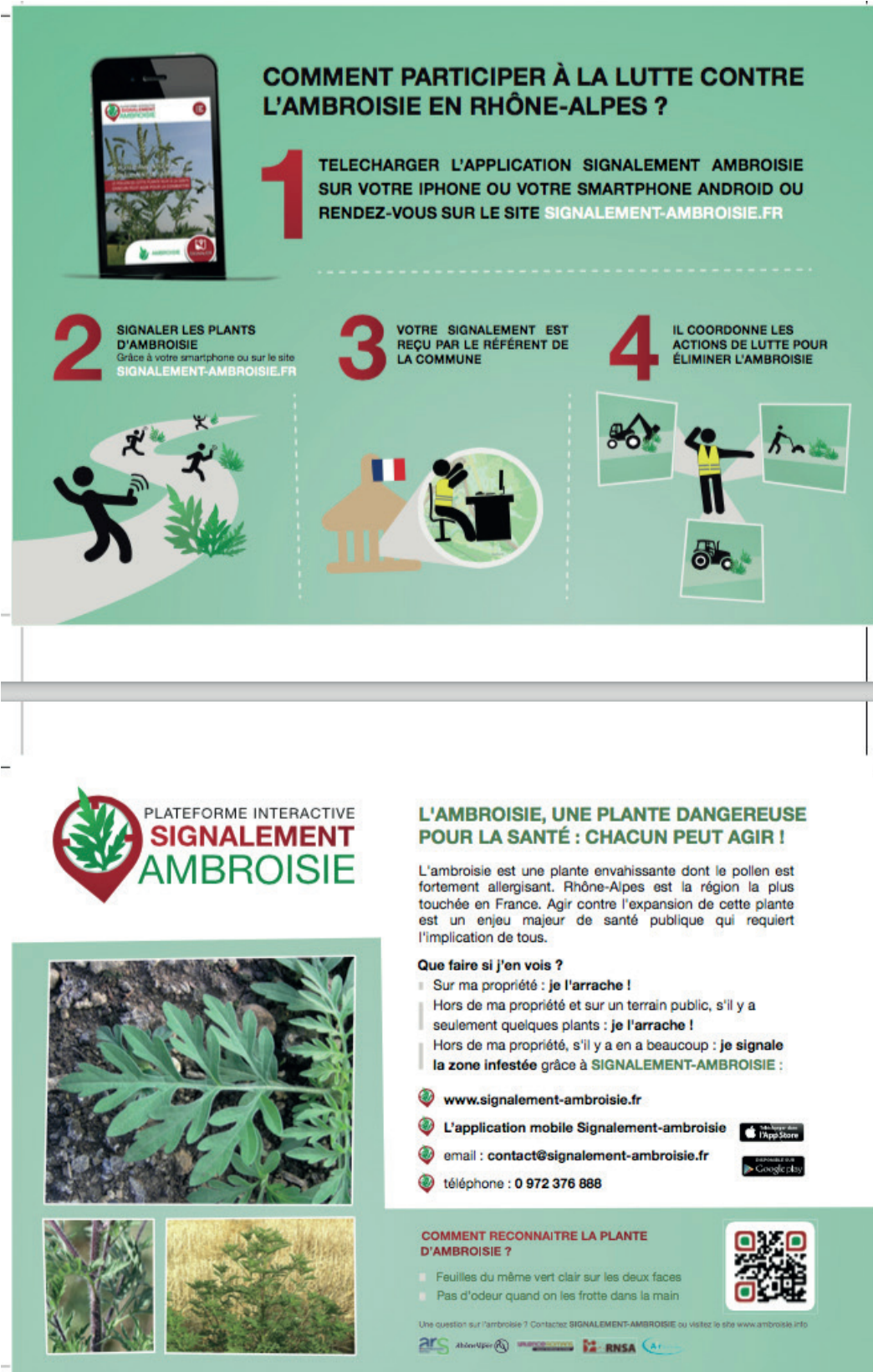
Figure 3. Fonctionnement de Signalement-Ambroisie. Operating of "Signalement-Ambroisie".